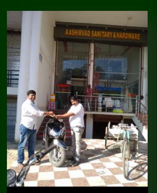
HONDA ACTIVA SCOOTY

Umang – an exclusive loyalty program for esteemed retailers – has helped our retail partners to earn more with Johnson Pedder.